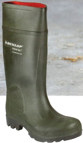
Schutzstiefel Purofort grün

*einmalig pro Kunde ab 777 € Nettowarenwert (solange der Vorrat reicht)